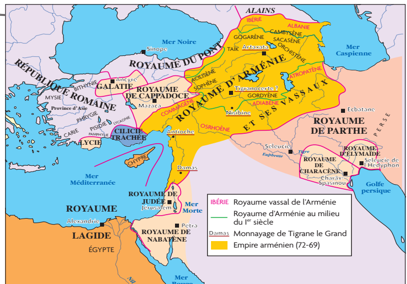
Document 3 : carte de l'Arménie à l'époque de Tigrane II Au premier consulat romain de Pompée et Crassus - 70 av. J.-C.