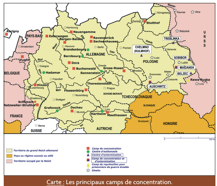
Carte : Les principaux camps de concentration.

Trace écrite : Dès Mein Kampf, Hitler affirme que les races sont inégales et que seule la race aryenne peut s'imposer aux autres races, inférieures à elle. Très vite après leur arrivée au pouvoir, les nazis promulguent des lois antisémites, telles les lois de Nuremberg, en 1935. Dans un premier temps, on parque les Juifs dans des quartiers isolés du reste de la ville – les ghettos. Ces ghettos sont vidés les uns après les autres à partir de 1942, lorsque le système concentrationnaire entre en service. Dans le seul camp de Tréblinka, qui n'a fonctionné qu'une année, près de 900 000 personnes perdent la vie. Le bilan de la politique nazie d'extermination est effroyable : elle est à l'origine de plus de 5 millions de victimes (toutes catégories confondues). Ces massacres ont concerné en grande majorité les civils (les deux tiers des victimes) mais ils n'ont pas épargné les soldats (un peu plus d'un tiers des victimes), surtout les soldats de l'armée rouge.