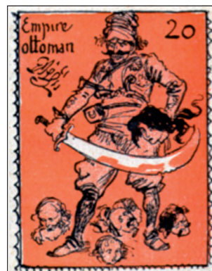
Document 2 : Timbre-actualité. Le sultan se livrant à quelques réformes sur ses sujets.