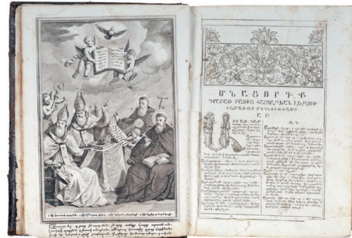
3. UNE ENCYCLOPÉDIE ARMÉNIENNE MEKHITAR DE SÉBASTE. [DICTIONNAIRE DE LA LANGUE ARMÉNIENNE]. VENISE : ANTONIO BORTOLI, 1749-1769. – 2 TOMES, IN-FOL.