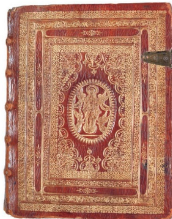
8. ENFIN, LA BIBLE (1666) [ASTWACAŠUNĠ / BIBLE]. AMSTERDAM : IMPRIMERIE SAINT-ETCHMIADZIN ET SAINT-SARGIS ZORAVAR, 1666. IN-4°.