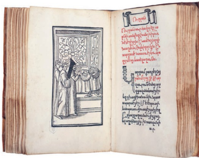
1. LE PREMIER LIVRE ARMÉNIEN (1512) LE LIVRE DU VENDREDI. VENISE : YAKOB MEGHAPART, [1512]. IN-80.