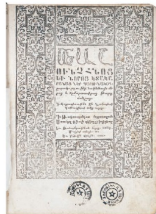
14. RÉÉDITION À CONSTANTINOPLE DE LA BIBLE D'AMSTERDAM (1705) [ASTWACAŠUNĠ / BIBLE] ԱՄՏՈՒՄԻՍՏԱՄԻՆԻՉ ԶՆՈՅ ԵՒ ՆՈՐՈՅ ԿՏԱԿԱՐԱՆԱՏ ՆԵՐ ՊԱՐՈՒՆԱԿՈՐ. - CONSTANTINOPLE : IMPRIMERIE SAINT-ETCHMIADZIN ET SAINT-SARGIS ZORAVAR, 1705. IN-4°.