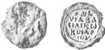
Avers : traces d'un aigle aux ailes éployées entre lesquelles il y aurait un monogramme cruciforme Revers « + ΔΑ-ΥΙΔ ΒΑ-ΣΙΛΙΚΩ ΚΙΝΑΤ-ΙΩ – David, cellierier impérial » Zacos, 1972, I, p. 496, n. 600.