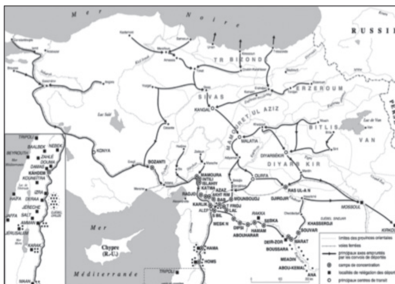
Document 2 : réseau concentrationnaire turc.

3. Quel est le but de ce réseau concentrationnaire ?