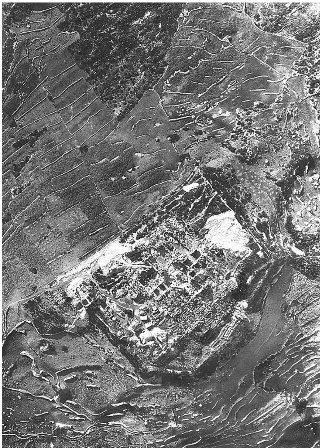
Vue aérienne du site de Saint-Syméon-Stylite-le-Jeune après les fouilles.