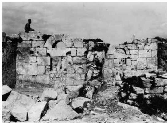
Fig. 6 – Vue, du côté ouest, sur le bouchage du passage entre la nef nord et une pièce annexe de l'église centrale et sur le bouchage du passage entre la nef sud et l'arrière de l'église nord (enveloppe 44 PCMA).