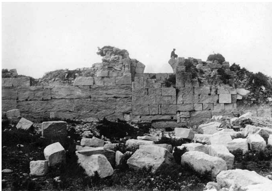
Fig. 17 – Vue sur la porte d'Antioche du côté nord (45 PCMA).