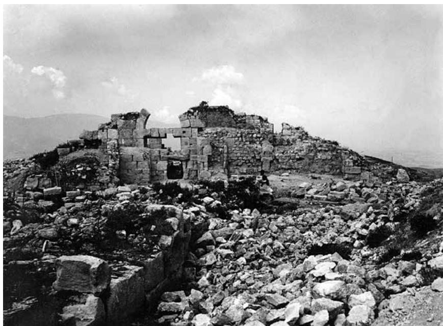
Fig. 14 – Vue sur la porte d’Antioche du côté sud (enveloppe 11 PCMA).