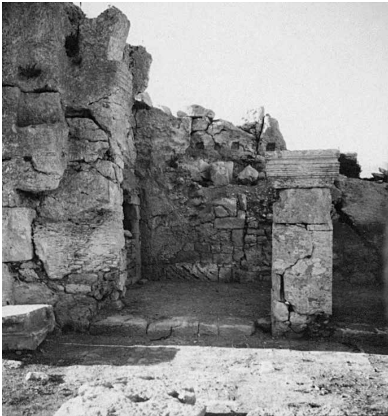
Fig. 4 – Vue, du côté de l’atrium, sur le bouchage dans le couloir nord-ouest du tétraconque (enveloppe 49 PCMA).

autre linteau du site n’a d’ornement de ce type. Sur la photo qui montre le même passage, mais du côté est, on voit le parement du bouchage qui correspond dans son intégralité au parement du mur, et, aux extrémités du linteau, se trouvent des trous qui pouvaient servir au montage d’une tringle à rideaux pour séparer l’intérieur de la pièce (fig. 6). Tous ces éléments (planche, jambages coupés, coquille et trous permettant l’installation du tissu) peuvent indiquer que le passage a pu être utilisé comme une niche dont la fonction reste cependant difficile à déterminer. Elle pouvait servir à l’exposition de reliques et d’un tableau sacré 22 .