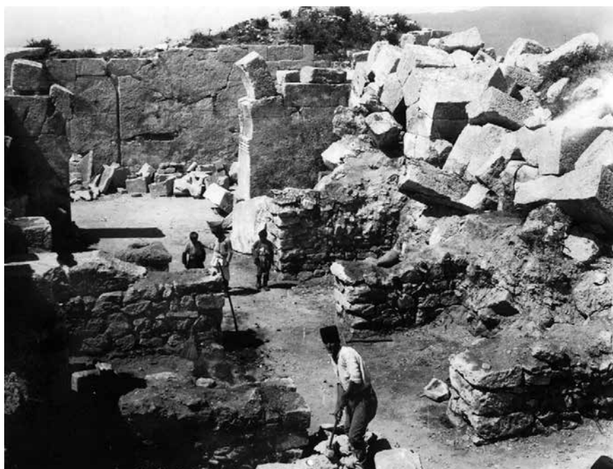
Fig. 9 – Vue sur la nef principale de l'église sud à partir du sud-est (enveloppe 95 PCMA).