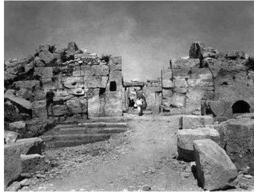
Fig. 11 – L'entrée sud vers la partie centrale du monastère. Vue prise du sud (enveloppe 48 PCMA).

Il est nécessaire de compléter les informations relatives au mur est de l'ensemble central. Sur le plan de Wachtang Djobadze, les appareils des murs est des pièces annexes nord de l'église sud, ainsi que ceux de l'église centrale sont reliés aux murs des absides de ces mêmes églises 26 . Cependant, les photos du père Jean Mécérian laissent plutôt conclure que ces murs n'étaient pas reliés aux absides des églises mentionnées plus haut. Ils ne faisaient qu'y atténir, en ayant des appareils de maçonnerie distincts, ajoutés à une période difficile à déterminer (fig. 12 et 13). Sur une des photos (fig. 12), on voit aussi un fragment du balcon (?) qui dépasse le revêtement du mur. Il ne figure sur aucun plan existant du site 27 .