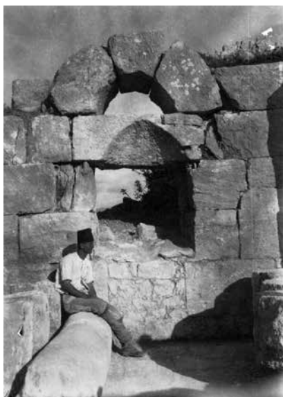
Fig. 5 – Vue, du côté ouest, sur le bouchage dans le passage entre la nef nord et une pièce annexe de l'église centrale (enveloppe 49 PCMA).