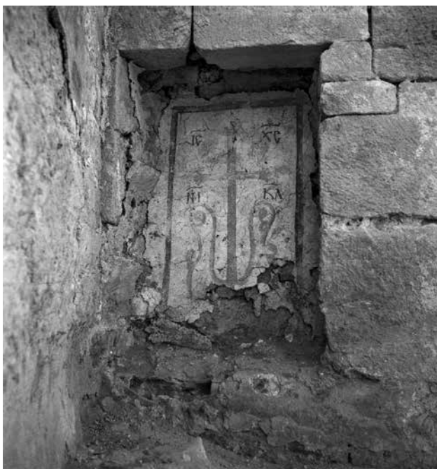
Fig. 16 – Croix peinte avec inscription dans une niche aménagée dans le mur sud de la porte d'Antioche (enveloppe 6N PCMA).