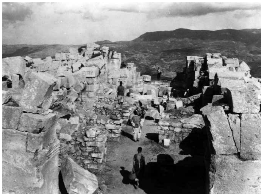
Fig. 8 – La nef principale de l'église sud vue à partir de l'ouest (enveloppe 3 PCMA).