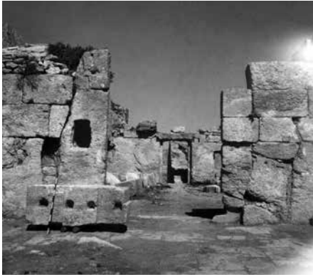
Fig. 10 – L'entrée sud vers la partie centrale du monastère. Vue prise du sud (enveloppe 49 PCMA).