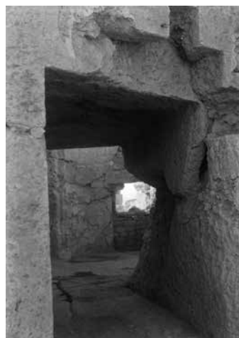
Fig. 3 – Le bouchage du couloir nord-ouest du tétraconque, vu du sud-est (enveloppe 23N PCMA).

tétraconque, se trouvent deux autres blocs de pierre. Il est difficile d'affirmer qu'ils firent partie de la construction disparue.