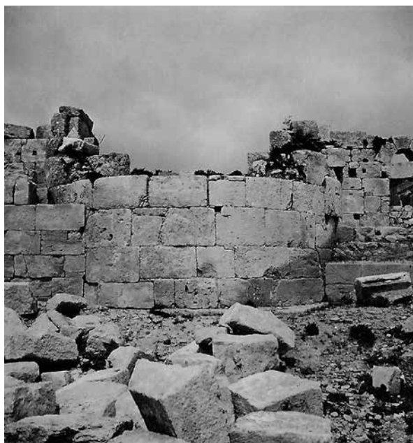
Fig. 13 – Vue du côté est sur l'abside de l'église centrale (enveloppe 2.4-3 PCMA).