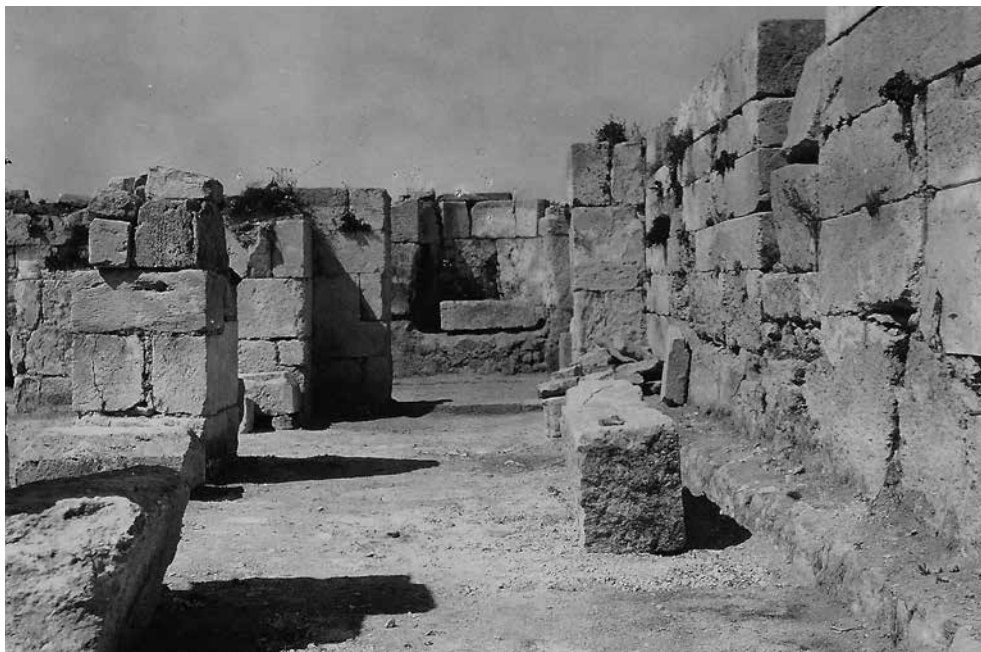
Fig. 7 – Vue, du côté est, sur la nef nord et sur le mur nord avec l'entrée bouchée à l'église nord (enveloppe 2.4-3 PCMA).