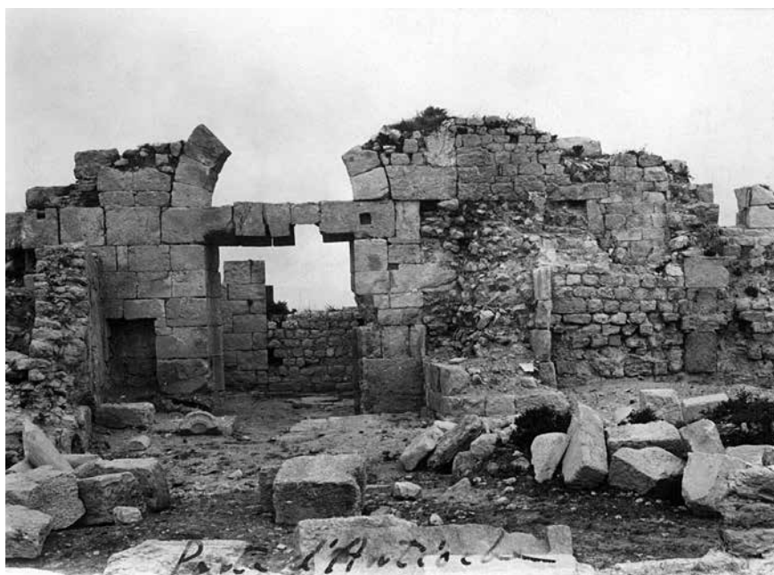
Fig. 15 – Vue sur la porte d’Antioche du côté sud (enveloppe 45 PCMA).