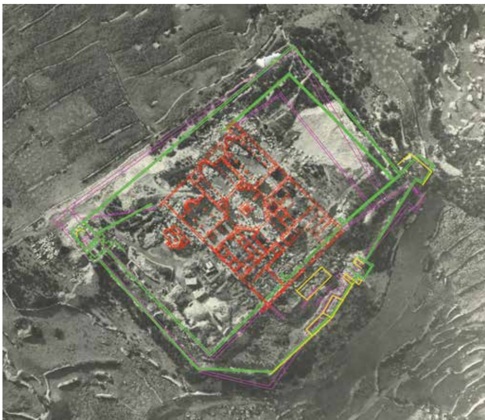
Fig. 18 – Photo aérienne du sanctuaire de Saint-Syméon-Stylite-le-Jeune (enveloppe 97 PCMA) avec superposition des plans réalisés par Jean Mécérian (MILLET, « Rapport du P. Mécérian sur les fouilles au monastère de Saint-Syméon le Jeune au Mont Admirable (Syrie) », et DJOBADZE, Archaeological Investigations in the Region West of Antioch on-the-Orontes ).