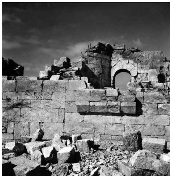
Fig. 12 – Vue du côté est sur la partie sud du mur est de l'ensemble central (enveloppe 49 PCMA).