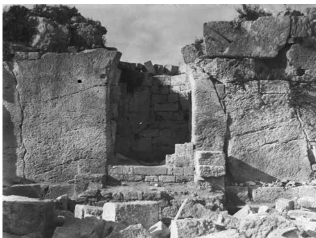
Fig. 2 – L'entrée nord-est du tétraconque avec des restes de son bouchage (enveloppe 23N PCMA).