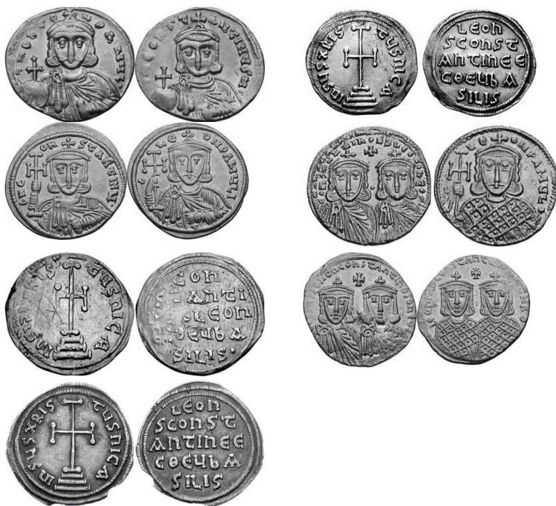
Նկ. 18 Լևոն III-ի, Կոստանդին V-ի, Լևոն IV-ի դրամները

https://coinweek.com/coinweek-ancient-coin-series-coins-of-the-iconoclasts/