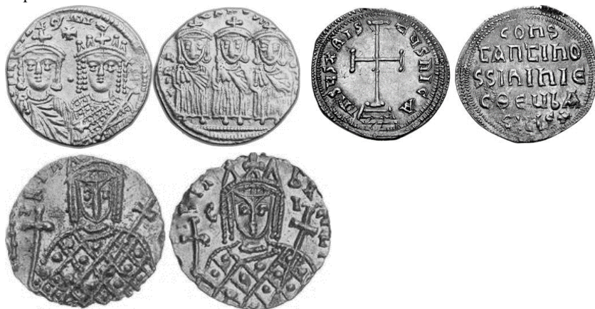
Նկ. 19 Կոստանդին VI-ի և Իրենեի դրամները

https://coinweek.com/coinweek-ancient-coin-series-coins-of-the-iconoclasts/