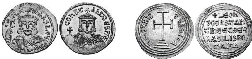
Նկ. 20 Լևոն V Հայկազնի դրամները

https://coinweek.com/coinweek-ancient-coin-series-coins-of-the-iconoclasts/