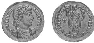
Նկ. 4 Վալենտինիանոս I-ի (364–367) ոսկե տլիդը https://www.coinarchives.com/a/results.php?search=Valentinian+I