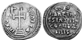
Նկ. 13 Կոստանդին VI-ի և Իրենեի միլիարեսիոնը վերահատված օմայան դիրհեմի վրա

https://www.coinarchives.com/a/results.php?results=100&search=Leo+III