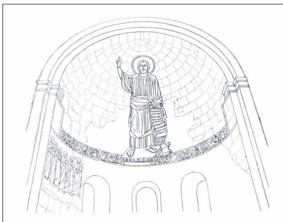
6. Քրիստոսի պատկերը Արուճի եկեղեցում, 669 թ., վերակազմությունը Ն. Զոթանյանի