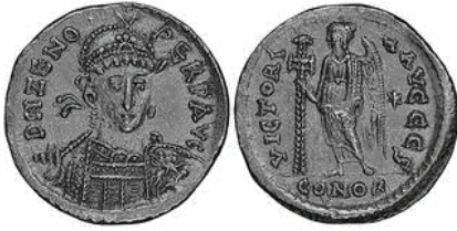
Նկ. 1 Օստգոթերի առաջնորդ Թեոդորիկի դրամը կայսր Չենոնի անունով