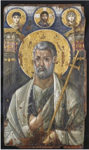
1. Ս. Պետրոս առաքյալ, Էնկաուստիկ սրբանկար, 600 թ., Ս. Կատարինե վանք, Սինայ