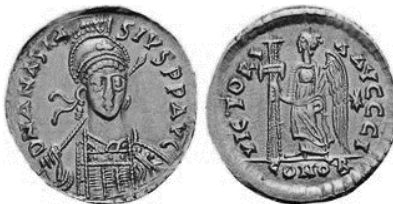
Նկ. 5 Անաստասիոսի (491–518) ոսկե տլիդը՝ Վիկտորիայով և խաչով https://www.coinarchives.com/a/results.php?search=Anastasius