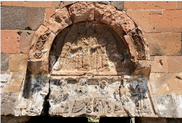
3. Մրենի եկեղեցու արևմտյան մուտքի քանդակները, 639 թ.