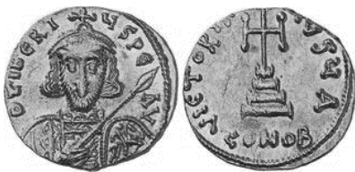
Նկ. 7 Տիբերիուս II-ի (698–705) սոլիդը՝ դարձ. խաչը աստիճանավոր հիմքին վրա

https://www.coinarchives.com/a/results.php?search=Tiberius+II