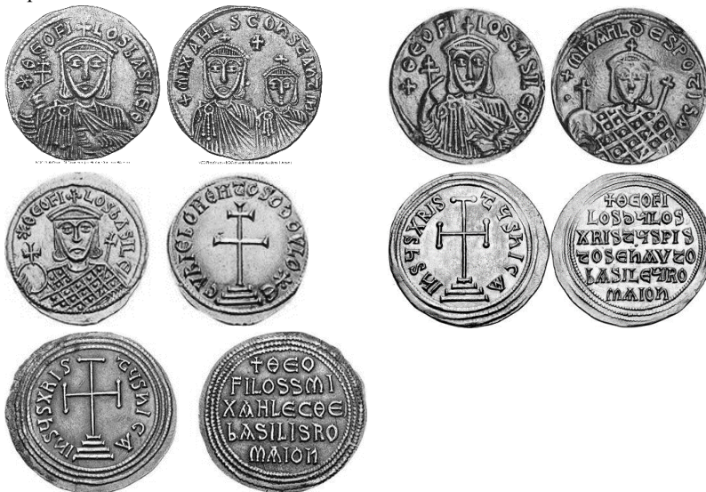
Նկ. 21 Թեոֆիլոսի դրամները