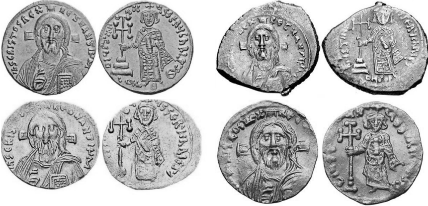
Նկ. 15 Հուստինիանոս II-ի (698–705) ոսկե սուլդ, արծաթե հեքսագրամ, ոսկե սեմիսիս, տրեմիսիս դրամները https://www.coinarchives.com/a/results.php?search=Justinian+II