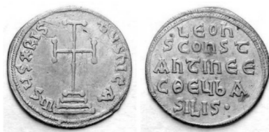
Նկ. 12 Արծաթե միլիարեսիոն հատված Լևոն III-ի կողմից

https://commons.wikimedia.org/wiki/File:Chrisme_Constantinople.jpg