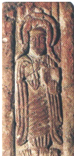
5. Քրիստոս, քառանիստ կոթողի դրվագ, Է դ.