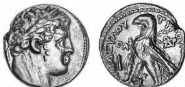
Նկ. 10 Տյուրուսյան արծաթե 1/2 ստատեր-սրբազան շեքերը

https://www.coinarchives.com/a/results.php?search=hexagram