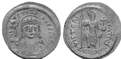
Նկ. 6 Հուստինոս II-ի (565–578) տլիդը Կոստանդնուպոլսի պատկերով