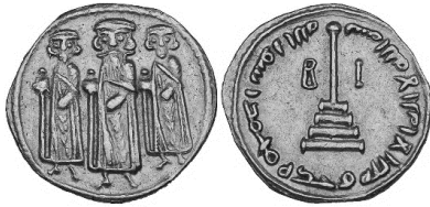
Նկ. 14 Աբդ ալ-Մալիքի՝ բյուզանդական տիպի ոսկի դրամը՝ շահադայով