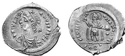
Նկ. 8 Հուստինիանոս I-ի (527–565) արծաթե դրամը, դարձ կայսրը լուսապսակով

https://www.coinarchives.com/a/results.php?search=Tiberius+II