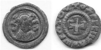
Նկ. 3 Արսունի թագավոր Էզանասի (330–358) ոսկեջրած պղնձե դրամը https://www.forumancientcoins.com/gallery/displayimage.php?album=249&pid=11822#top_display_media