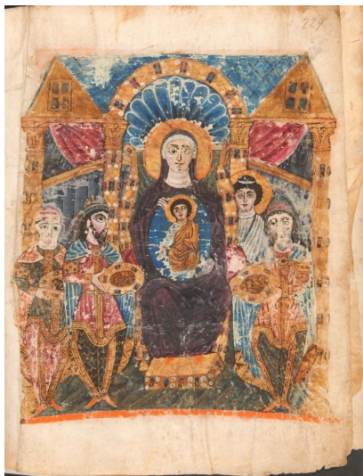
4. Մոգերի երկրպագությունը, մանրանկար, Չ-Է դդ.