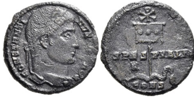
Նկ. 2 Կաստանդին Մեծի (307–337) պղնձե ֆոլիսը՝ Բրիտոնի մենագրով https://www.coinarchives.com/a/results.php?search=Constantinus+AND+Victory+AND+Follis