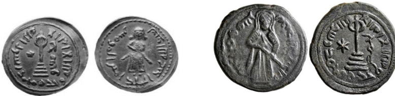
Նկ. 16 Աբդ ալ-Մալիքի «կանգնած խալիֆ» տիպի ոսկե դրամը և պղնձե դրամը՝ Աբդալլահ գրությամբ https://www.coinbooks.org/esylum_v18n15a29.html