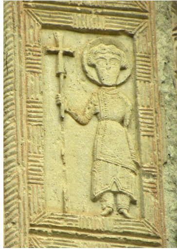
2. Անհայտ սուրբ, Օձունի հուշակոթողի դրվագ, Է դար