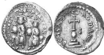
Նկ. 9 Հերակլետոսի (610–641)

https://www.cngcoins.com/Coin.aspx?CoinID=58224#