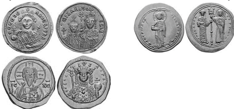
Նկ. 23 Թեոդորա կայսրուհու և Միքայել III-ի դրամները

https://coinweek.com/coinweek-ancient-coin-series-coins-of-the-iconoclasts-part-ii/