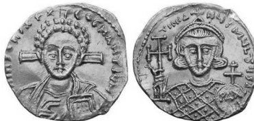
Նկ. 17 Հուստինիանոս II-ի (698–705) 2-րդ իշխանության շրջանի ոսկե սուլդ https://www.coinarchives.com/a/results.php?search=Justinian+II